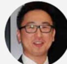
Chor Teh Investec