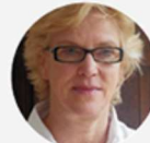
Leigh Hill A-Team Group